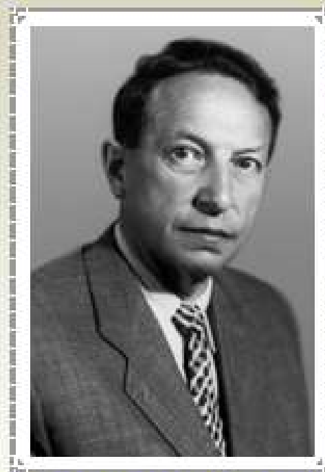
Вениамин Каверин (1902 – 1989)