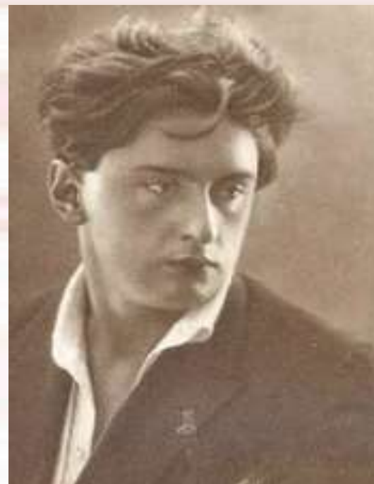
Иосиф Павлович Уткин

И доколе дубы-нелюдимы Надо мной не склонятся, дремля, Только ты мне и будешь любимой, Только ты да родная земля!