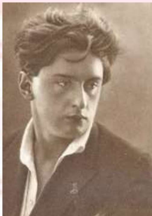
Иосиф Павлович Уткин