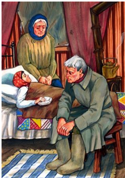
Л. Пантелеев «Маринка»

Рассказ Л. Пантелеева начат в блокадном Ленинграде, закончен в Москве, в госпитале летом 1942 года. Впервые автор читал рассказ по московскому радио осенью того же года.