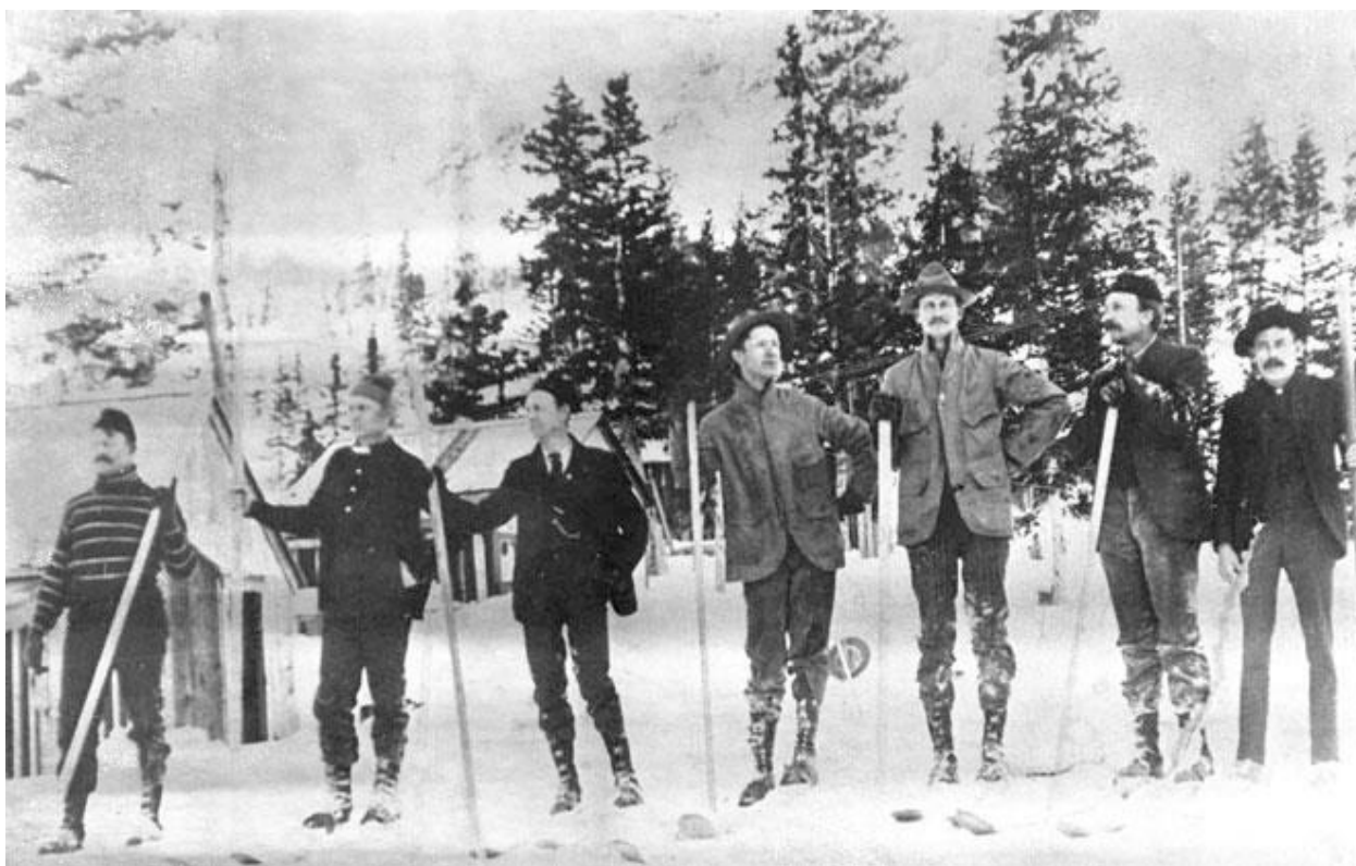
Участники соревнований на скорость в Калифорнии

Обычно накануне соревнований золотоискатели встречались в салуне, чтобы определить ставки, призы и назначить дату гонки. В том виде, который называли Schuss (то есть спуск на лыжах без поворотов), участники соревнований на лыжах длиной 12 футов (3,65 м) катились прямо вниз по склону. Они неслись, используя длинный шест для сохранения равновесия, и разгонялись до 62 миль в час (100 км/ч) и даже больше. Чтобы сделать гонку ещё более острой, участники стартовали одновременно в «гешмоззель-старте». В виде приятного бонуса победителей ожидало солидное денежное вознаграждение. Участники этих заездов устанавливали местные рекорды скорости. Так, в 1878 году Томми Тодд развил невероятные для того времени 87 миль в час (140 км/ч).