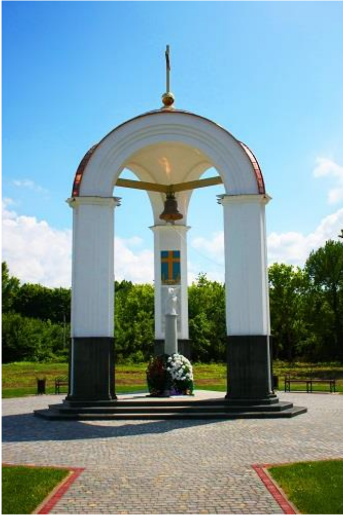
Ротонда памяти воинов, погибших в Полтавской битве.