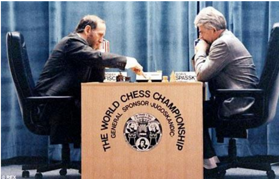
Бобби Фишер и Борис Спасский, Югославия, 1992 год

Спасский регулярно участвовал в турнирах примерно до 2002 года, сыграв матч против Корчного в 2009 году. (Каждый выиграл по две партии при четырех ничьих). В 1978 году он стал гражданином Франции, но в 2012 вернулся в Россию, где проживает до сих пор.