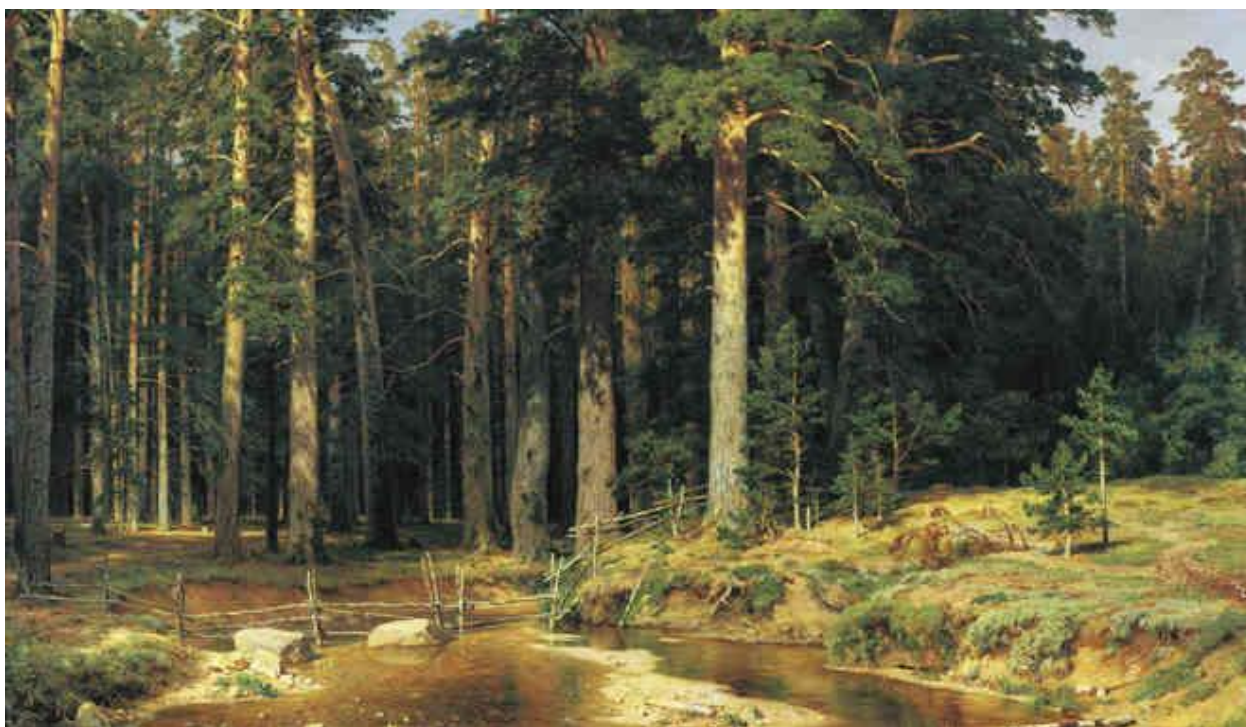
«Корабельная роща» (1898 г.)

Блестящим итогом почти полувекового пути художника в отечественном искусстве стала картина «Корабельная роща» (1898 г.). Ее можно считать классической по завершенности, полноте художественного образа, монументальности звучания. В основу произведения легли этюды, сделанные в Елабуге. Роль Ивана Шишкина в русском искусстве оставалась столь же значительной и в те годы, когда в пейзажной живописи появилось множество великолепных произведений И. Левитана, В. Серова, К. Коровина.