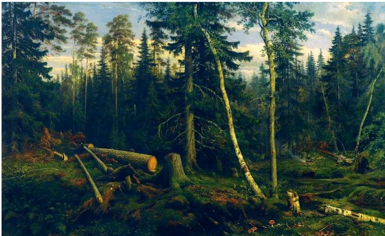
И. Шишкин, «Рубка леса», 1867 год

Добиваясь предельного сходства с натурой, художник на первых порах тщательно выписывает каждую деталь, и это мешает целостности образа. Примером таких работ является картина «Рубка леса».