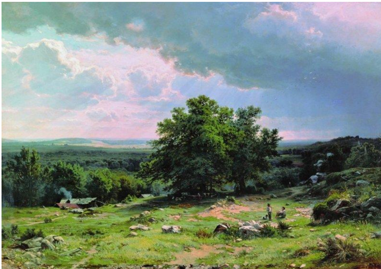
Вид в окрестностях Дюссельдорфа, Иван Шишкин, 1865 год, Русский музей

Он не только рисовал, но и много писал маслом. Присланные из-за границы работы были одобрены академическим начальством и появились на выставке 1865 года. Особо в академии отметили успехи Шишкина в рисунке и гравировании. Но ни европейская пейзажная живопись, ни европейская природа особого впечатления на Шишкина не произвели. Хотя, время было потрачено не зря, о чем свидетельствует явное совершенствование его мастерства. Кстати, написанная им тогда картина «Вид в окрестностях Дюссельдорфа» принесла Шишкину звание академика, а в 1867 году была отправлена на Всемирную выставку в Париж.